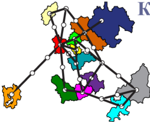
Схема регионов КВМР-2017